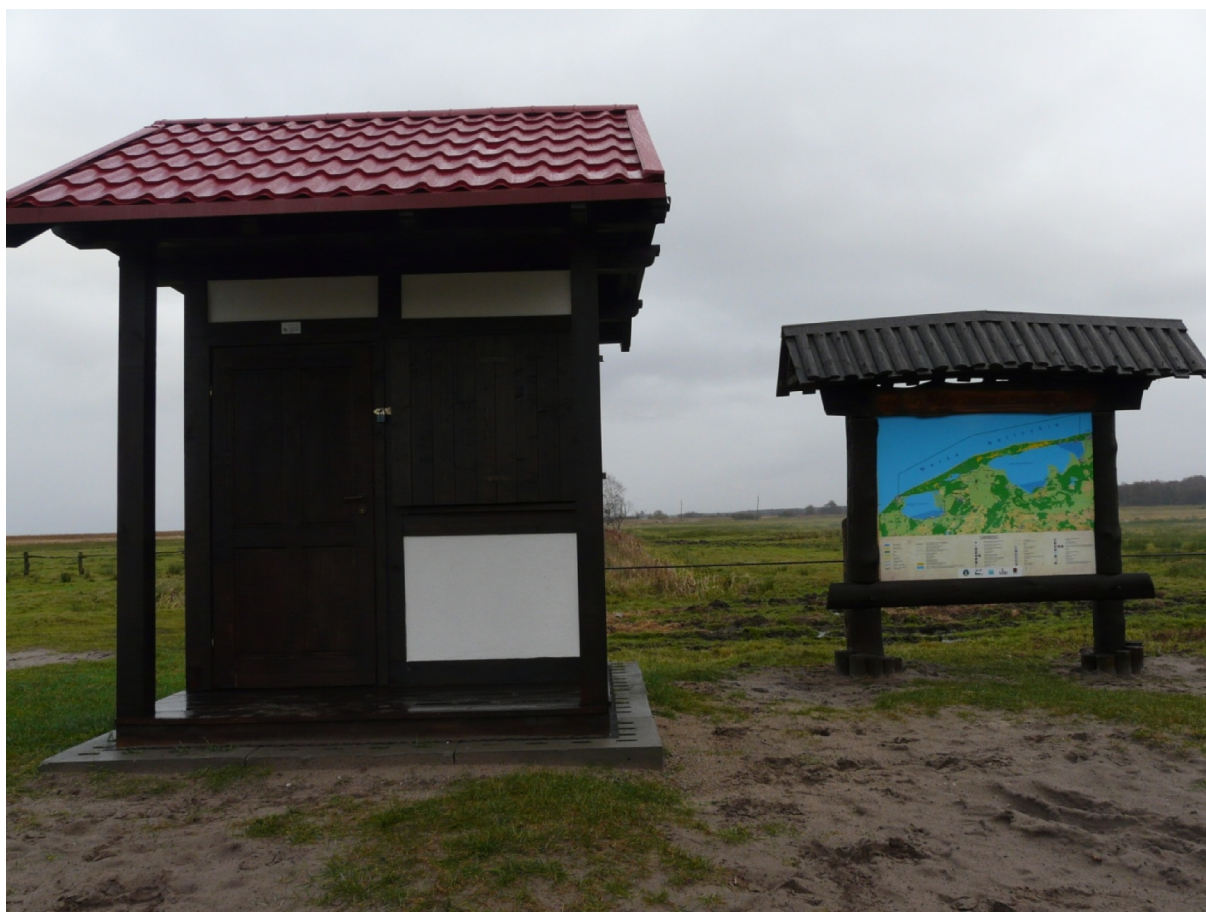
Punkt informacyjno-dydaktyczny mały na parkingu w Klukach