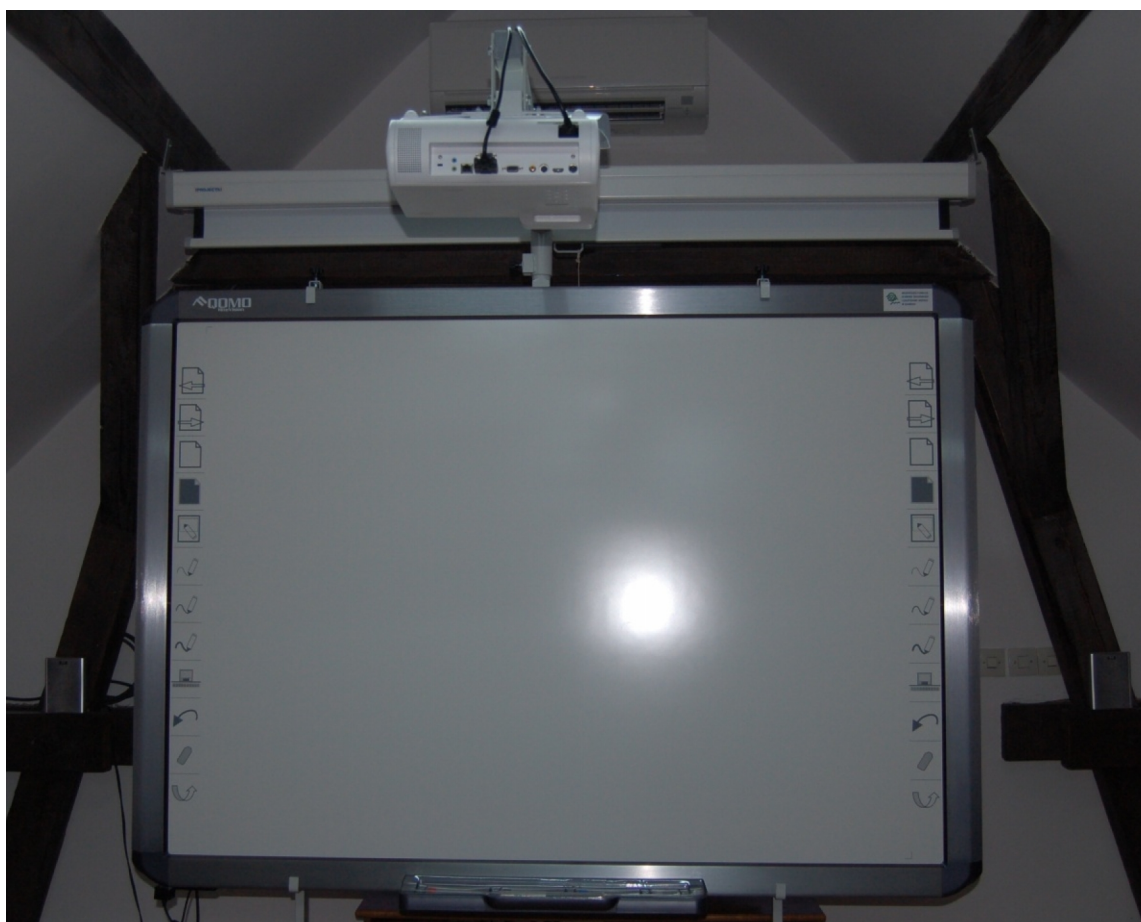
Zestaw interaktywny - tablica interaktywna, projektor krótkoogniskowy, stojak do tablicy i uchwyt do projektora.