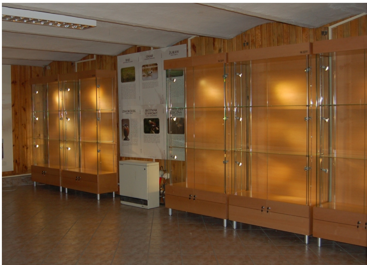
Gabloty ekspozycji przyrodniczej Muzeum w Smołdzinie.