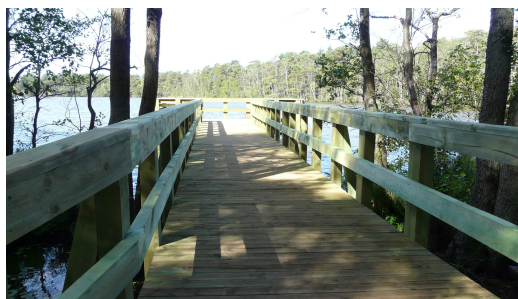
Pomost nad jeziorem Dołgie Małe

Finansowanie rekonstrukcji: Fundacja EkoFundusz