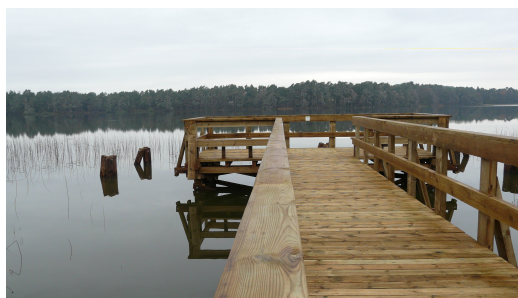
Pomost nad jeziorem Dołgie Duże

Głównym celem projektu jest ochrona najbardziej wrażliwych siedlisk nadbrzeżnych jezior Łebsko, Gardno, Dołgie Duże oraz Dołgie Małe przed wydeptywaniem. Drugim celem jest dostosowanie organizacji ruchu turystycznego na terenie Parku do nowych potrzeb wynikających ze wzrastającej liczby przyjeżdżających osób oraz planów budowy ośrodka muzealnego w Czołpinie na bazie zabytkowej osady latarników. Realizacja projektu umożliwi wprowadzenie nowych form edukacji terenowej, czego efektem będzie wzrost akceptacji społecznej dla ochrony przyrody oraz ograniczenie negatywnych skutków zwiększającej się antropopresji.